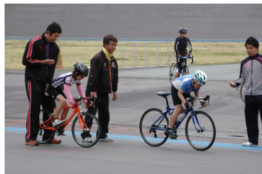
トラック競技活動風景