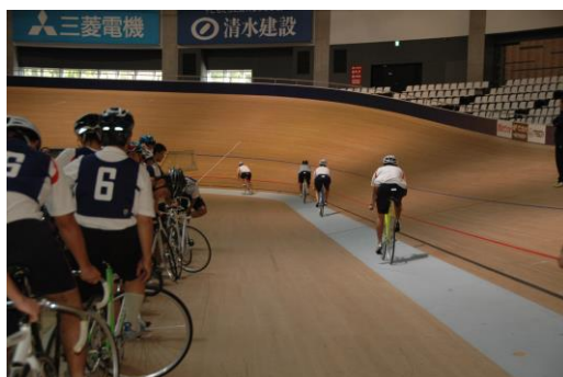
伊豆総合高等学校