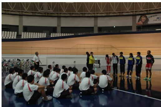
伊豆総合高等学校