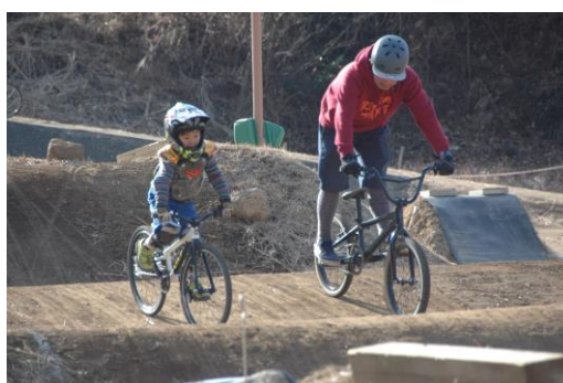
トラック競技活動風景