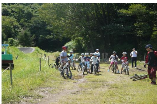
伊豆市ふるさと学級