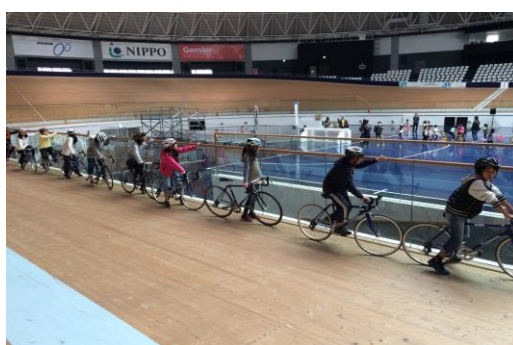
修善寺駅前子供会