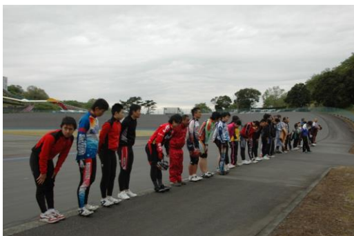
トラック競技活動風景

地元のスポーツ少年団にも登録している「伊豆サイクルスポーツクラブ」においては、本センター内の自転車競技施設を訓練会場に活動し、トラック・MTB・BMXの各競技の実技指導を本センターの指導員並びに外部指導員の協力のもと実施している。